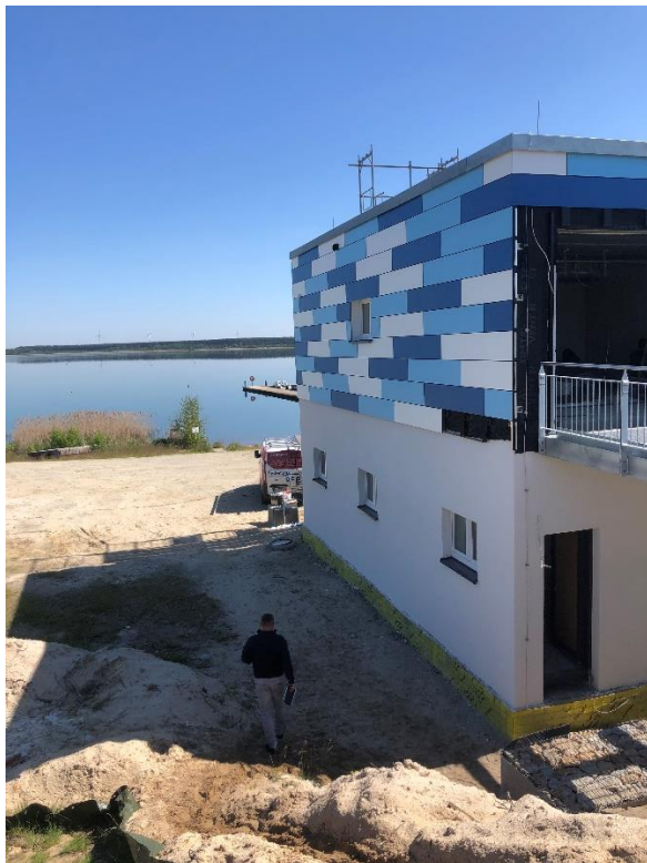
Blick von der Zufahrtsstraße