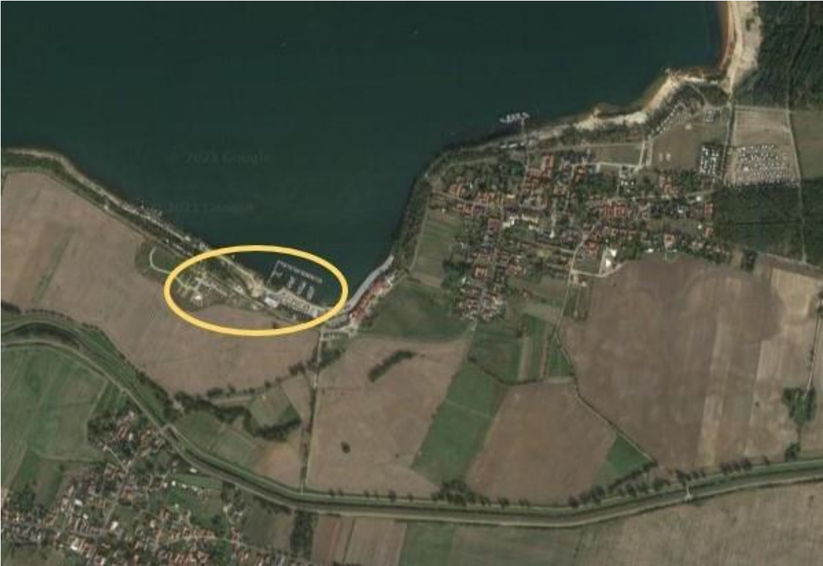
Anlage 1: Lage des Wasserwanderrastplatzes am Geierswalder See